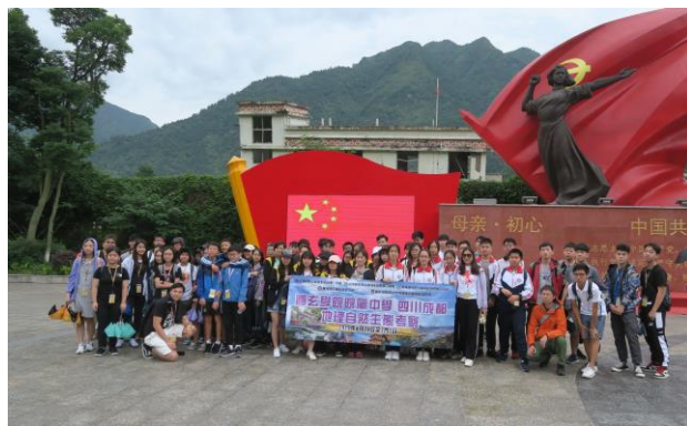
1. 【圓玄學院院屬中學四川成都地理自然生態考察團】