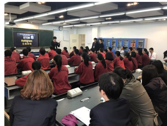
3. 【蘇港姊妹中學師生交流團 2019】