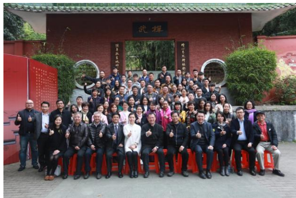
4. 【粵港澳大灣區教育文化之旅——穗港澳姊妹學校走進禪武國際文化】