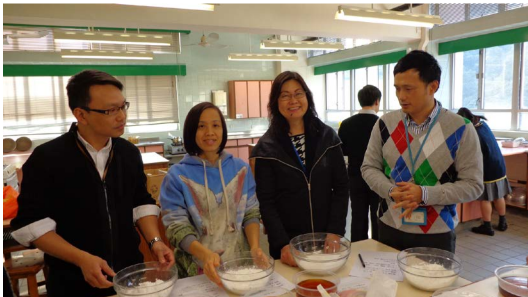
希望今次有好成績！