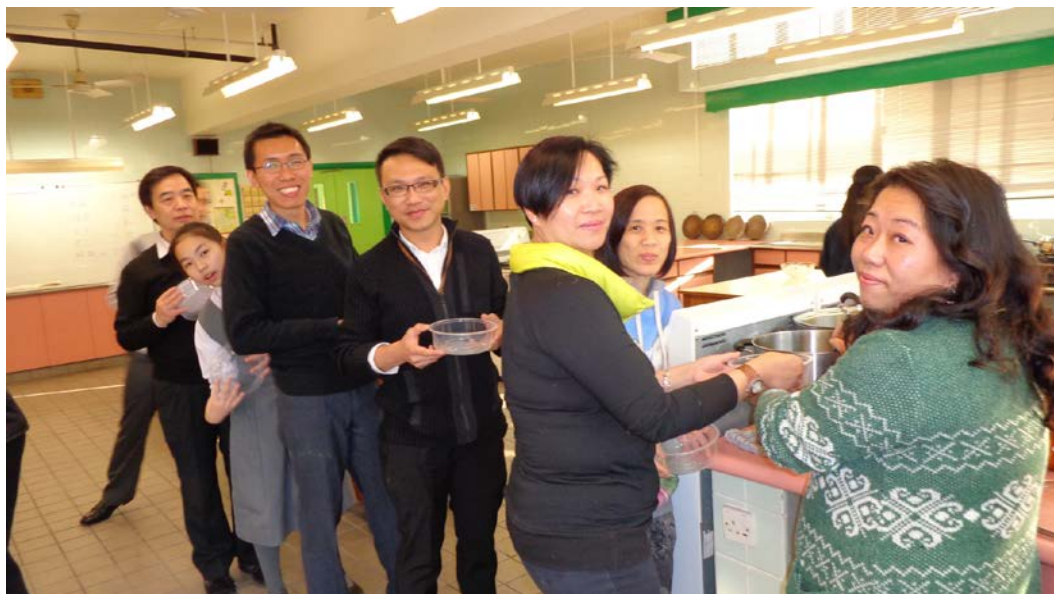
排隊取材料，有秩序！