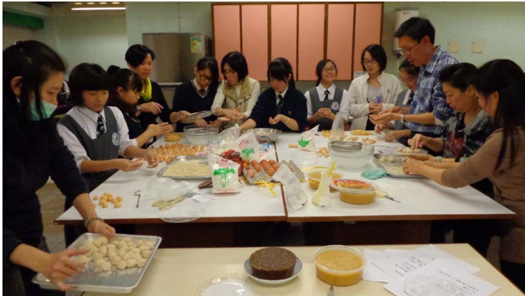
聚精會神搓笑口棗