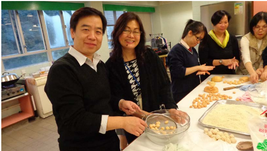
英文老師對傳統文化也有濃厚的興趣