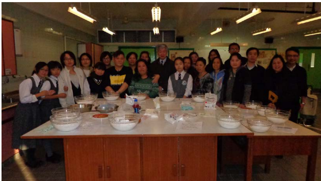
陣容鼎盛，家校一心