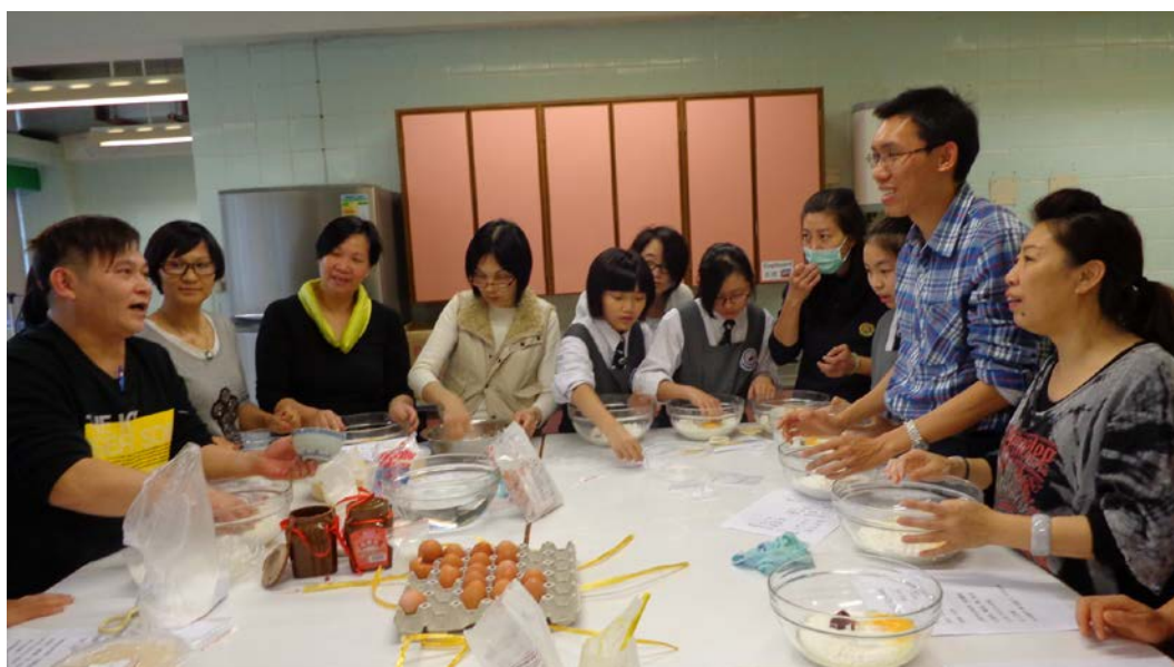
周師傅教授製作技巧