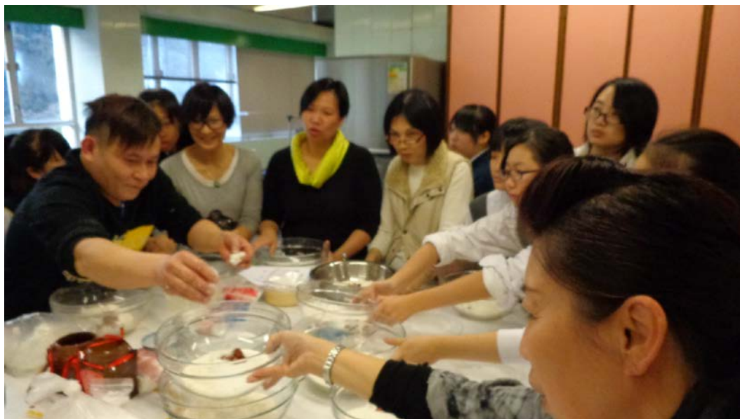
你爭我奪？不，是爭先恐後．．．